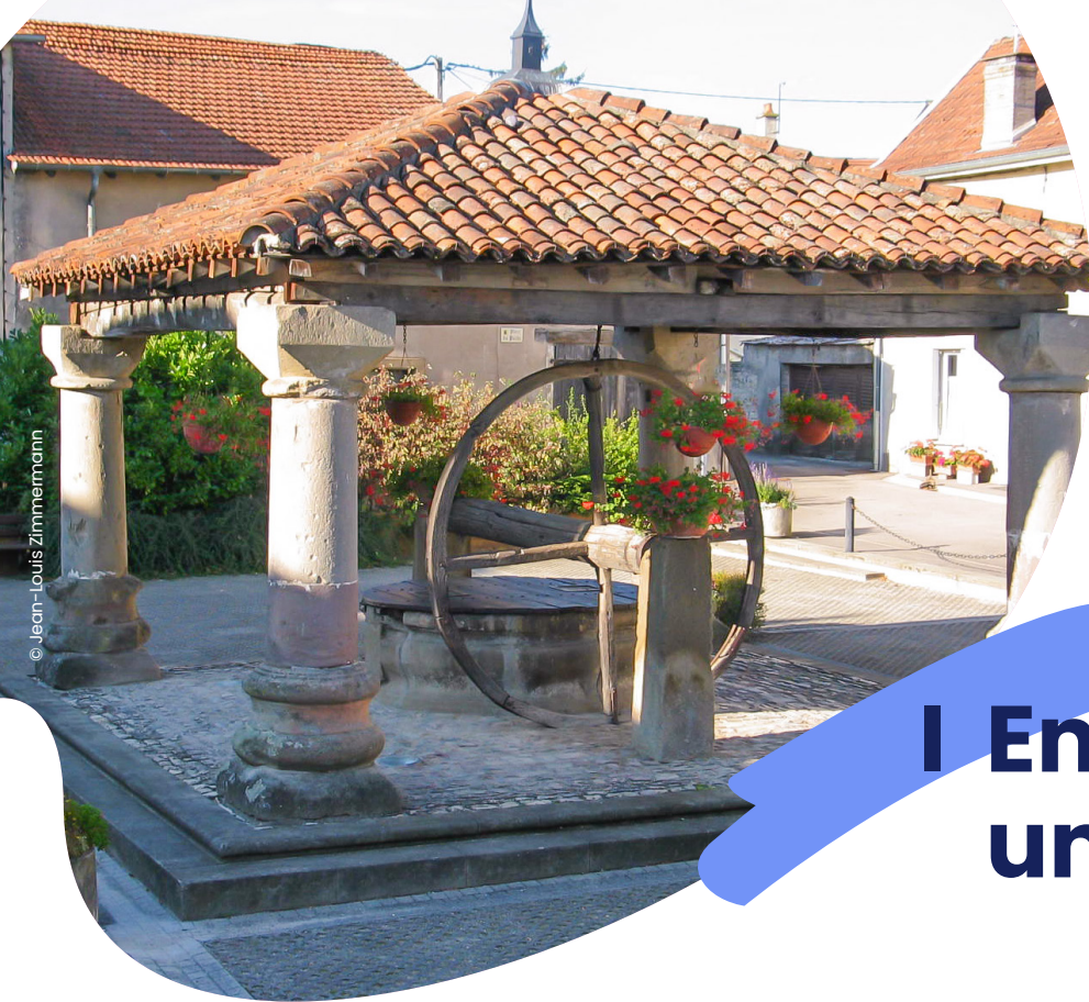
◀ Puits de Poussay